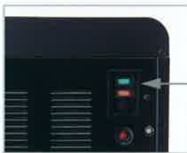
本体背面 緑色のスイッチを押すと省エネモードに。