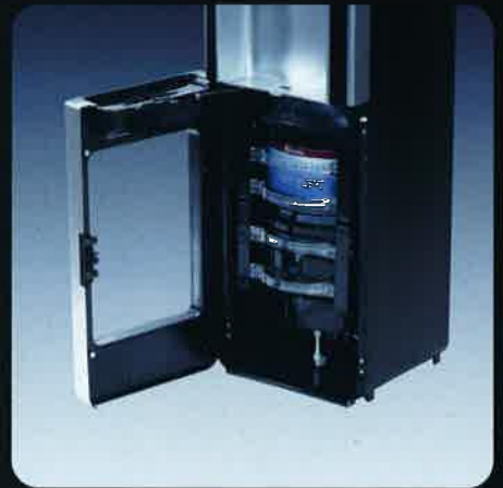
ボトルガードアームを戻す。