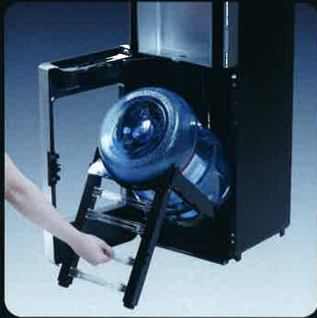
ボトルガードアームを引き出す。

ボトル交換はお客様にお願いしています。だから、少しでもご負担を小さくしたい。手軽でカンタン、スマートなボトル交換の仕組みを、とことん考え抜きました。